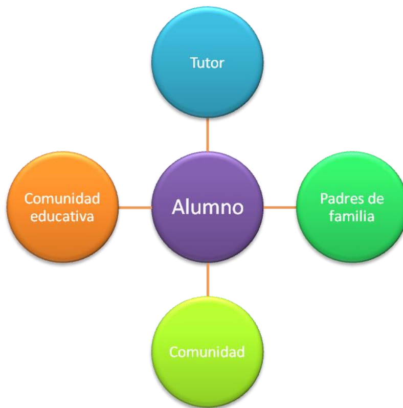
Actores involucrados en la acción tutorial

Manuel Álvarez, et al (2007), destacan que “partiendo de la idea de que los padres se sientan comprometidos, será mayor su participación en la medida en que se sientan copartícipes y coprotagonistas de la formación integral de sus hijos”, por lo tanto es importante informarles de los aspectos generales del programa de tutorías académicas, su finalidad, objetivos, actividades a desarrollar, etc., y por otro se les debe explicar en qué aspectos, de qué forma y en qué momento colaborarán en el desarrollo del mismo.